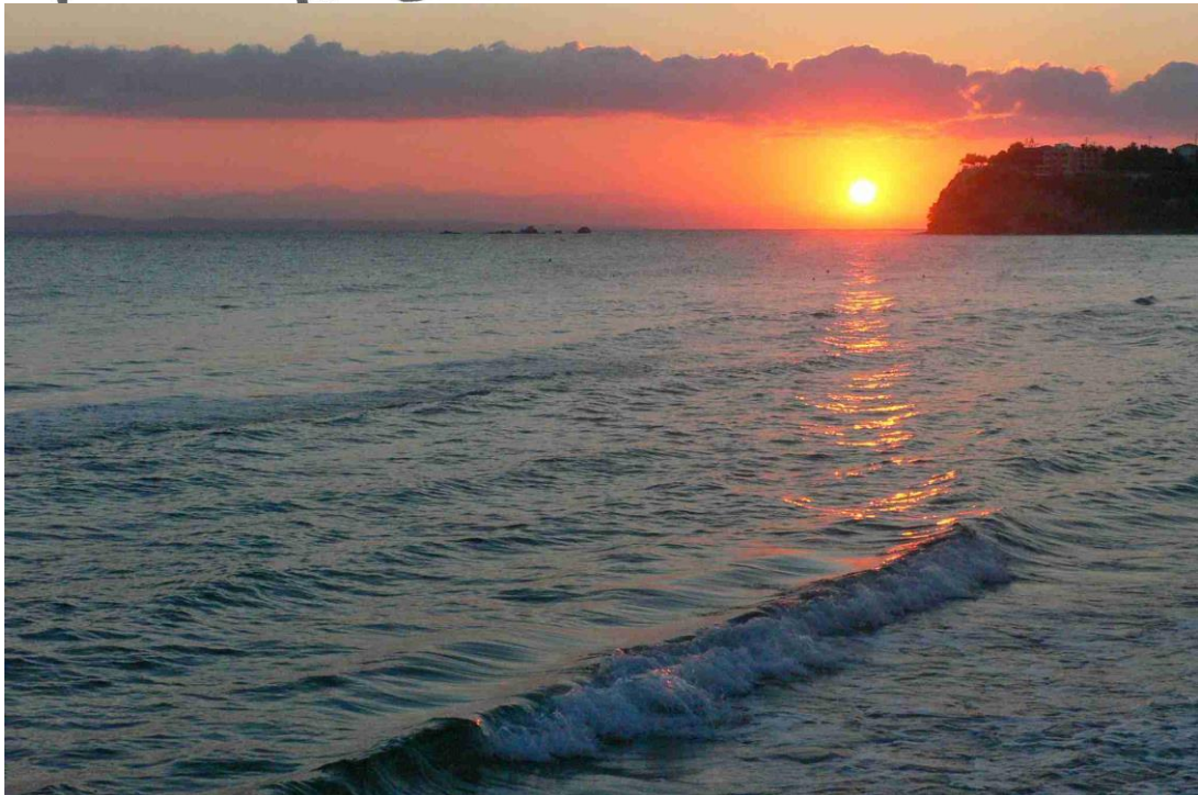
Selim: Z dovolené na Zakynthosu